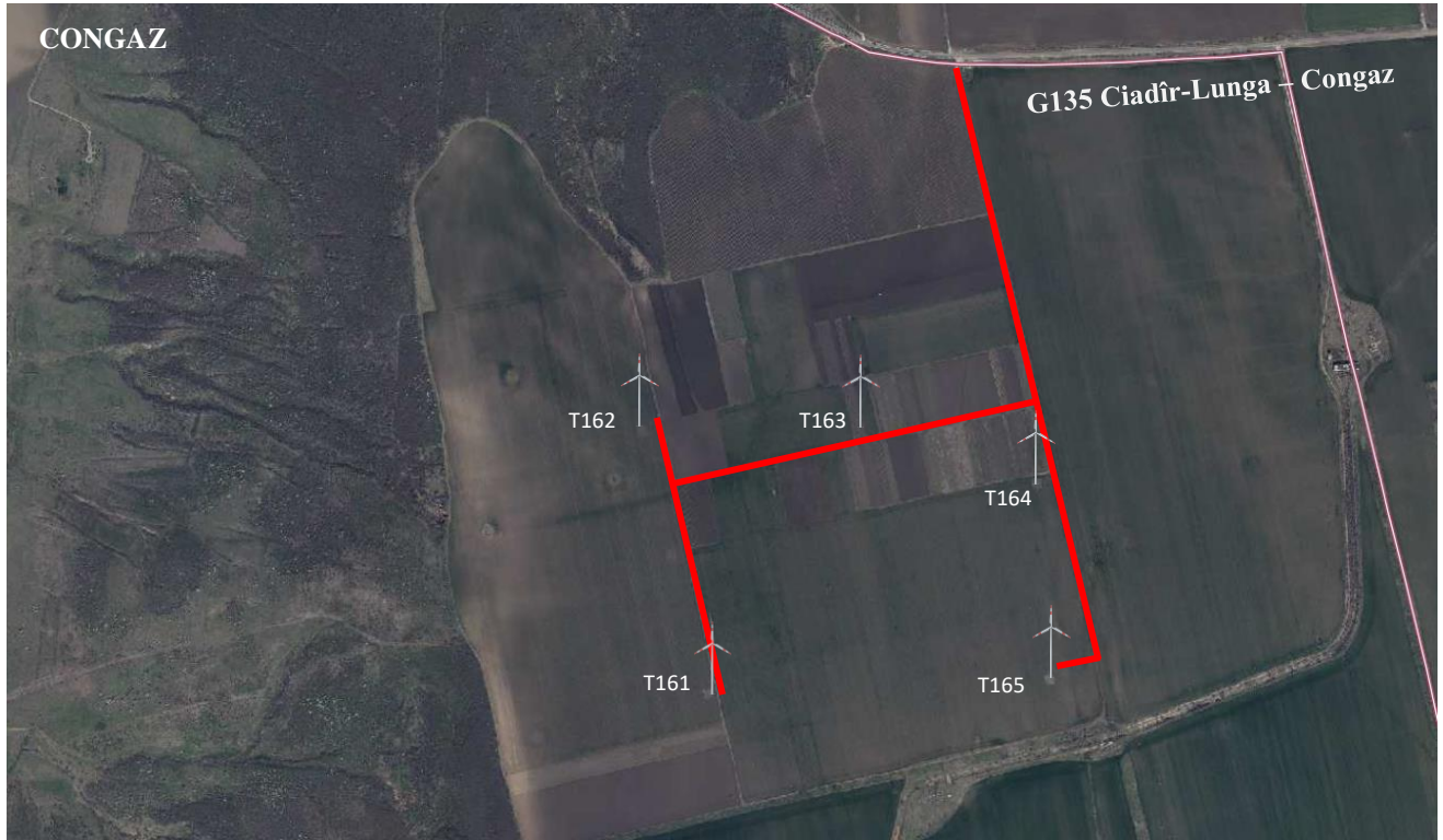
Figura 6.2. Localizarea proiectului CEE Congaz-1. Căi de acces.

șenile, încărcător frontal pe șenile, instalație de forat, macara pe pneuri, macara pe șenile, vibrator de interior pentru beton, spațiu liber de obstacole pe înălțime pe întreg traseul drumului de acces va fi de minim 5 m.