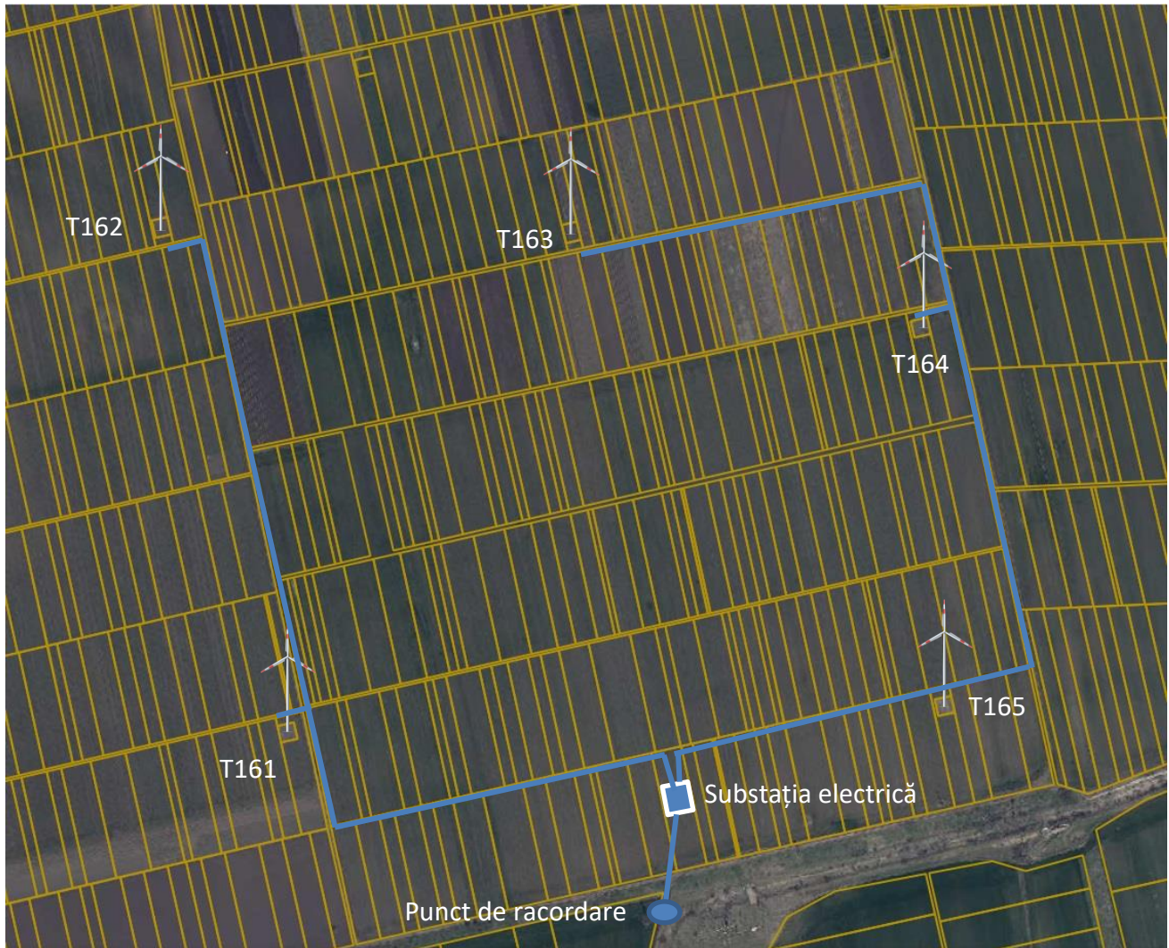
Figura 7.1. Localizarea proiectului CEE Congaz-1. Rețele electrice.

Relieful. Extravilanul satului Congaz, situat în Unitatea Teritorială Autonomă Găgăuzia din sudul Republicii Moldova, este caracterizat printr-un relief specific Stepei Bugeacului. Acesta este un relief de câmpie colinară și de podiș fragmentat, puternic influențat de procesele de eroziune și de rețeaua hidrografică.